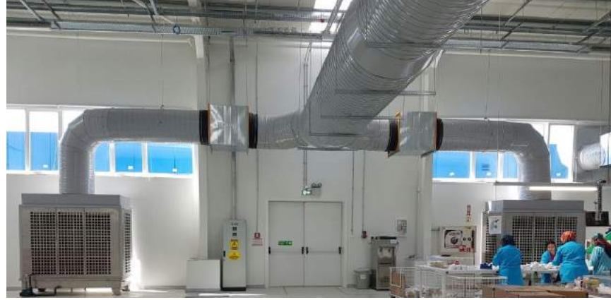
Hemak Formahane Bölümü HVAC Sistemi (80.000 m³/h) Uygulaması

Her ölçekteki endüstriyel ve ticari alanların soğutulmasında diğer bütün sistemlere göre en az enerji sarfeden sistem evaporatif soğutma sistemidir.