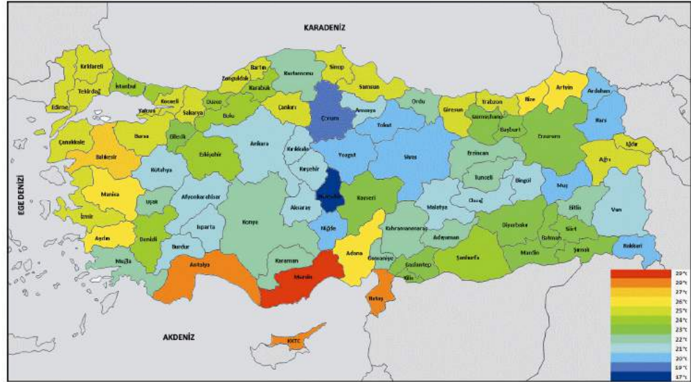
(HAS) Hemak Endüstriyel Hava Sistemleri