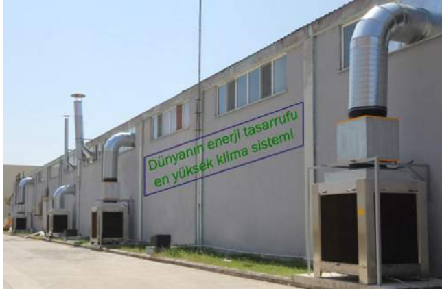
Hemak Nonwoven Üretim Holü HVAC Sistemi (160.000 m³/h) Uygulaması